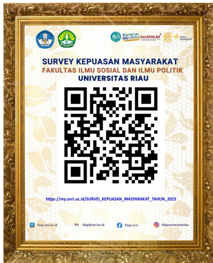
Gambar 1 QR Code SKM FISIP

Responden dalam survei ini adalah seluruh pengguna layanan pada ruang ketua jurusan/kaprodi, ruang pimpinan beserta koordinator dan sub koordinator yang ada di lingkungan FISIP UNRI. Survei dilakukan pada bulan Juli hingga bulan September Tahun 2023. Setelah responden menerima pelayanan di lingkungan FISIP UNRI, responden diarahkan untuk melakukan scan Quick Response Code ( QR Code ) yang sudah ditempelkan di setiap ruangan atau melalui link https://my.unri.ac.id/SURVEI_KEPUASAN_MASYARAKAT_TAHUN_2023 , kemudian data yang masuk akan disortir berdasarkan triwulan yang sedang dilakukan SKM.