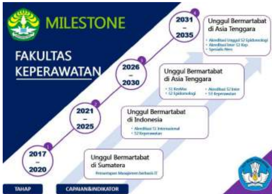
Gambar 2.2. Milestone FKp Unri

Selanjutnya tonggak-tonggak capaian ( milestone ) Fakultas Keperawatan disajikan dalam bentuk grafis berikut: