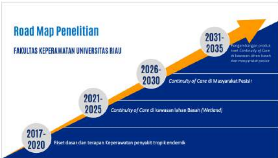
Gambar 2.3. Road Map Penelitian dan Pengabdian FKp Unri

Road Map Penelitian FKp Unri dirinci sebagai berikut: