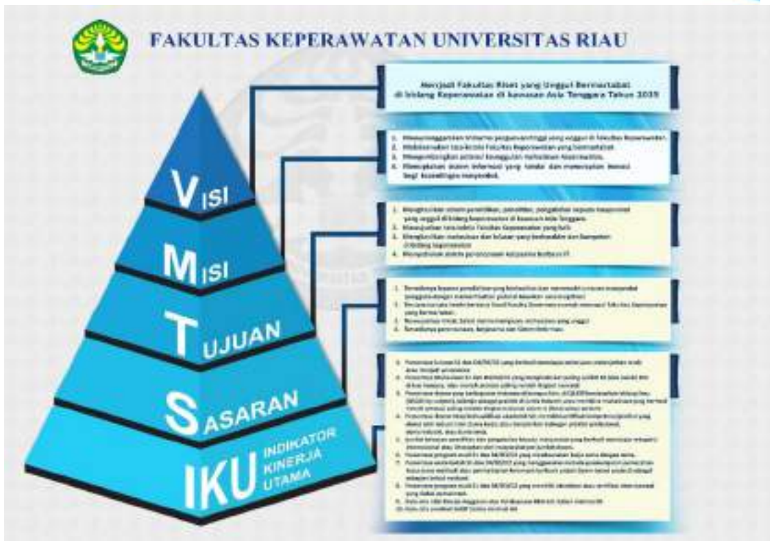
Gambar 2.1 Visi, Misi, Tujuan, Sasaran dan IKU Fkp Unri