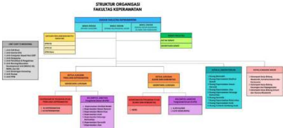
Gambar 3.1. Struktur Organisasi FkP Unri

Struktur Organisasi FkP adalah seperti gambar berikut :