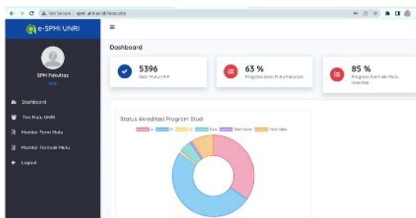
Gambar 2. Persentase Progress Isian Mutu dan Progress Formulir Mutu FKIP Siklus II

Progress isian pada siklus II mengalami peningkatan dari sebelumnya. Persentase peningkatan progress isian mutu dapat dilihat pada gambar 3. Pada siklus I, progress isian mutu hanya mencapai 44% dan progress formulir mutu hanya sebesar 15%. Namun, pada pengisian isian mutu dan formulir mutu masih menemui beberapa kendala. Hal ini terlihat dari masih banyaknya data isian yang teridentifikasi tidak valid dan belum lengkap.