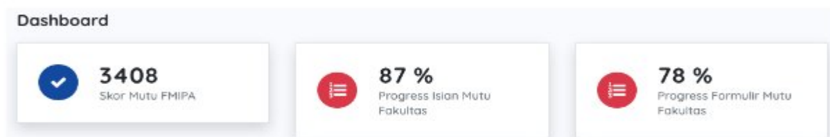
Gambar 2 Presentase kelengkapan isian data e-spmi

Kondisi eksisting data pada pengisian data e-spmi dilihat berdasarkan persentase kelengkapan isian mutu dan kelengkapan dokumen formulir mutu. Adapun hasil pengisian 11 Prodi yang ada di FMIPA bisa dilihat pada Gambar 2 dan Gambar 3.