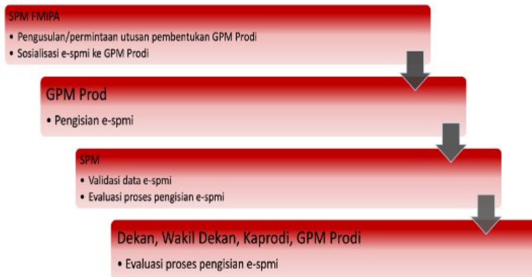
Gambar 1 Mekanisme Pelaksanaan Monitoring