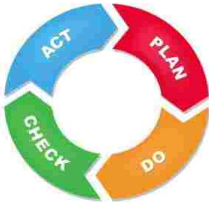
Gambar 4 Metode Pelaksanaan Standar Mutu

Berikut manajemen dalam pelaksanaan standar mutu terdiri dari: