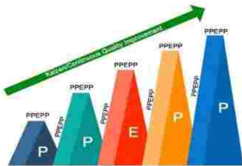
Gambar 6 Proses Perbaikan Mutu